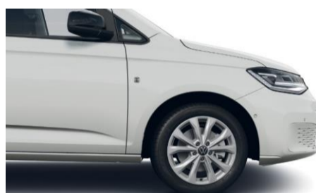
17" Barahona alufælge i brilliant sølv