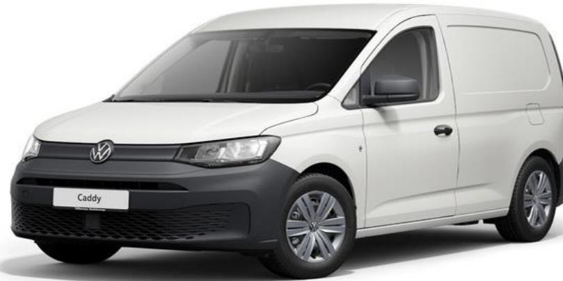
Comfort Udover basis udstyr