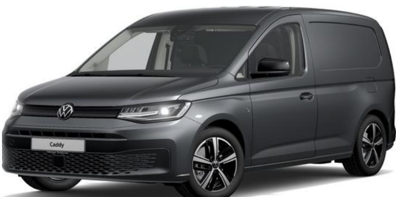
Indium Grey (X3X3) Metallak