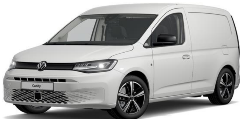
Candy White (B4B4) Standard lak

Nedenstående farver er de mest populære. Se flere farver hos din lokale Volkswagen forhandler. Bilerne er vist med ekstraudstyr.