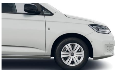
16" stålfælge med heldækkende hjulkapsler