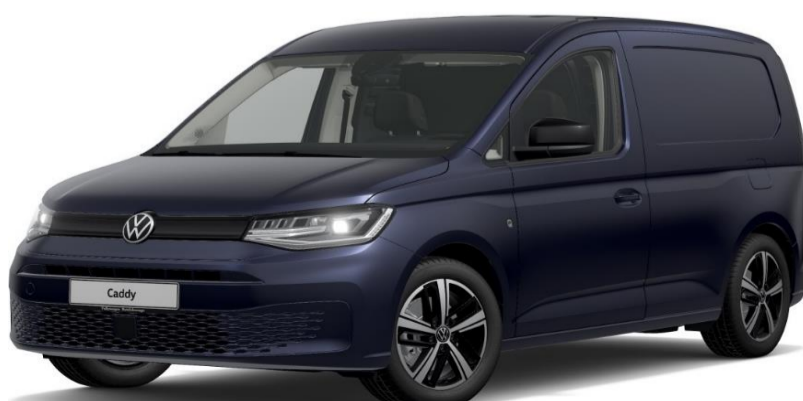
Starlight Blue (3S3S) Metallak

Detailprislister. Priskode R03. Modelår 2025