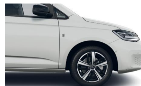
17" Colombo alufælge i sort/sølv

Nedenstående farver er de mest populære. Se flere farver hos din lokale Volkswagen forhandler. Bilerne er vist med ekstraudstyr.