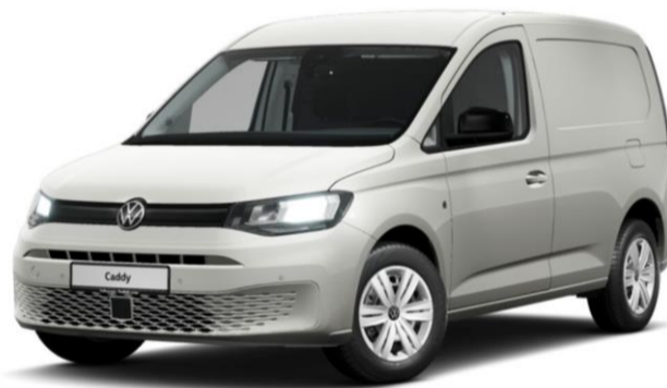
Comfort Udover basis udstyr