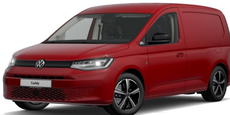
Cherry Red (4B4B) Unilak