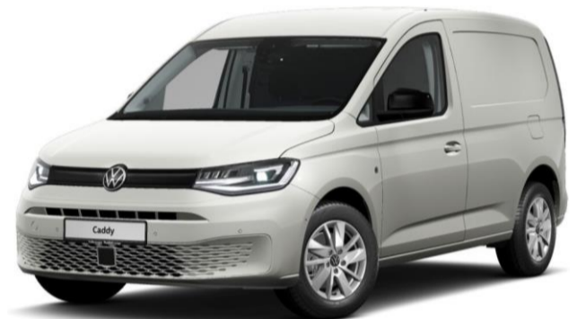
Pro Udover Comfort udstyr