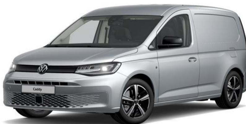
Reflex Silver (8E8E) Metallak