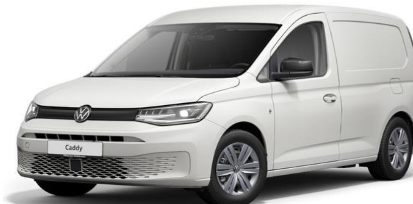
Pro Udover Comfort udstyr