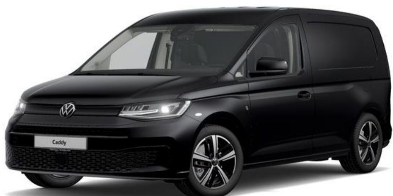
Deep Black (2T2T) Perleeffekt